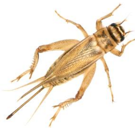
จิ้งหรีดตัวเต็มวัยเพศเมีย

ศูนย์ส่งเสริมเยาวชนเกษตร จังหวัดกาญจนบุรี