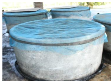
บ่อเลี้ยง