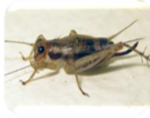
(5) จิ้งหรีดเล็ก