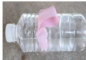
ขวดให้น้ำ (พร้อมผ้าซับน้ำ)