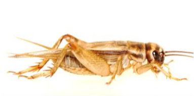
จิ้งหรีดตัวเต็มวัยเพศผู้