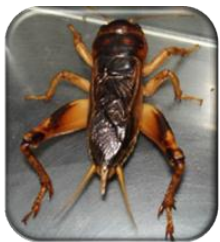
(1) จิ้งหรีดโกร่ง