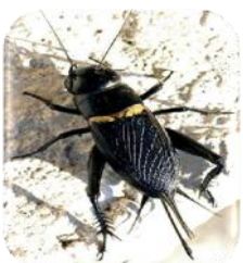
(2) จิ้งหรีดทองคำ