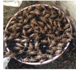
ขั้ววงไข่ (ทรายผสมเกลบเผา)