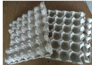
แผงไข่ไก่ (ชนิดกระดาด)