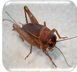
(3) จิ้งหรีดทองแดง