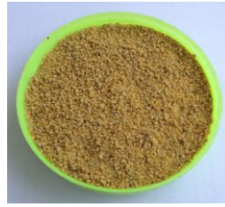
งานให้อาหาร (อาหารไก่ไข่เล็ก)

5. เมื่อจิ้งหรีดมีอายุ 50-60 วัน จะเข้าสู่ตัวเต็มวัยและพร้อมที่จะผสมพันธุ์ จิ้งหรีดเพศผู้จะเริ่มร้องเรียกจิ้งหรีดเพศเมียดัง กริก กริก ยาวๆ