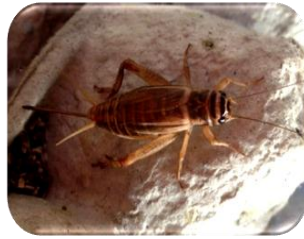
(4) จิ้งหรีดทองแดงลาย